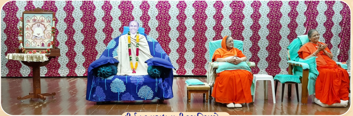
કીર્તન આરાધનાની સ્મૃતિપળો...