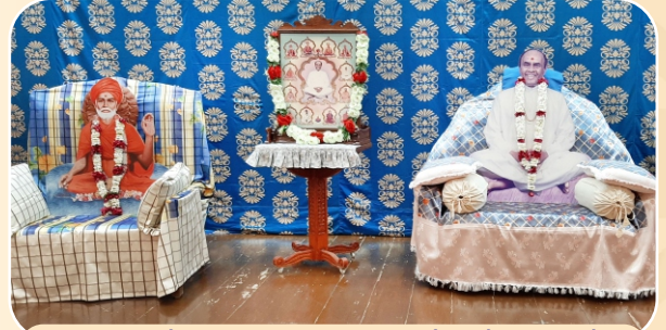
પ્ર.સ્વ.શાસ્ત્રીજીમહારાજના પ્રાગટ્યદિનની ઉજવણી...