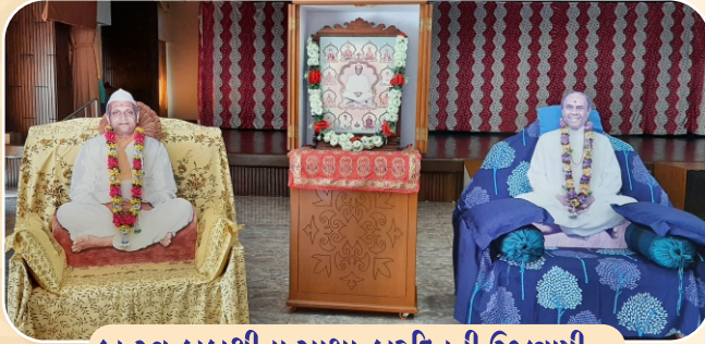
પ્ર.સ્વ.કાકાશ્રીના સાક્ષાત્કારદિનની ઉજવણી...