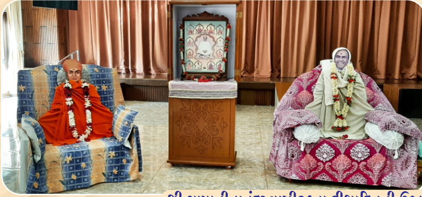
શ્રી ગુણાતીતાનંદસ્વામીજીના દીક્ષાદિનની ઉજવણી...