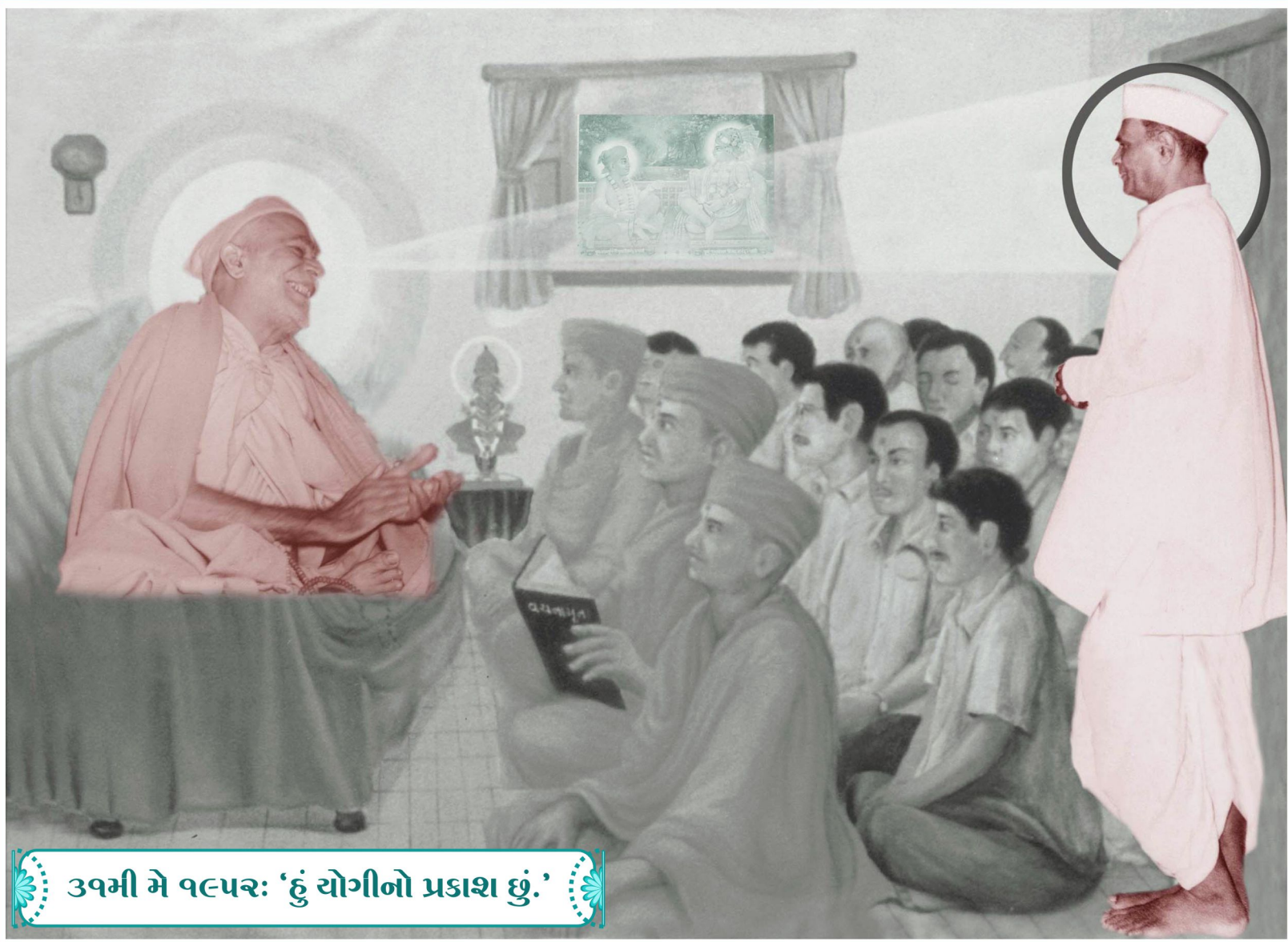
૩૧મી મે ૧૯૫૨: 'હું યોગીનો પ્રકાશ છું.'