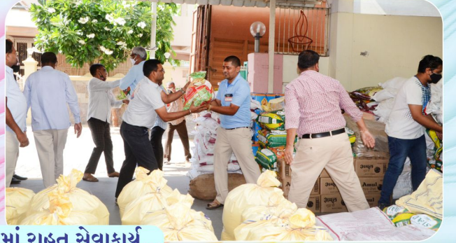
કોરોના મહામારી કાળમાં રાહત સેવાકાર્ય...