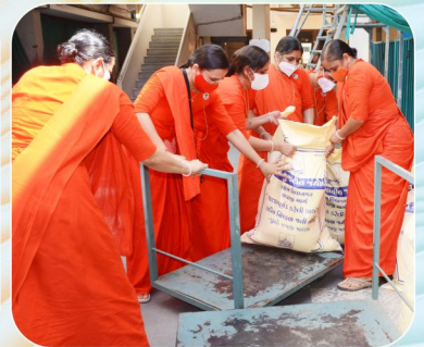
કોરોના મહામારી કાળમાં રાહત સેવાકાર્ય..