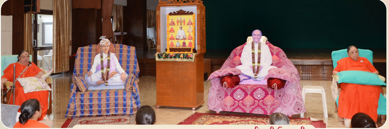
તા.૧૭.૩.૨૦૨૨ : ધ્ર.સ્વ.ભગતજીમહારાજના પ્રાગટ્યદિનની ઉજવણી...

RNI NEW DELHI NO : 20485/71 PO REGD NO : G-AND-336/2022-24 Lic Valid Upto: 31.12.2024 DATE OF PUBLICATION : 21st of every month DATE OF POSTING : 21st of every month PLACE OF PUBLICATION (POSTED AT) : Vallabh Vidyanagar MDG 388120