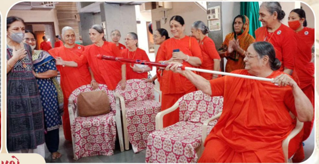
તા.૧૮.૩.૨૦૨૨ : રંગોત્સવની સ્મૃતિપળો...