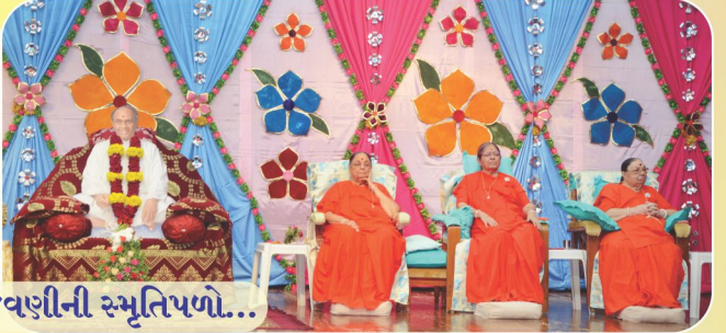
ગુરુપૂર્ણિમા ઉજવણીની સ્મૃતિપળો...