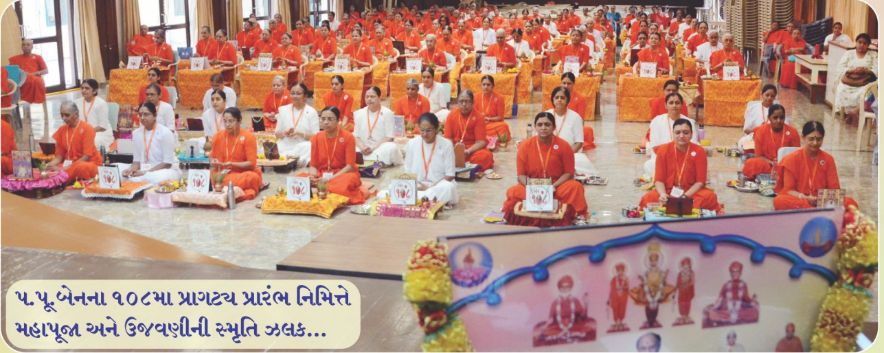
પ.પૂ.બેનના ૧૦૮મા પ્રાગટ્ય પ્રારંભ નિમિત્તે મહાપૂજા અને ઉજવણીની સ્મૃતિ ઝલક...