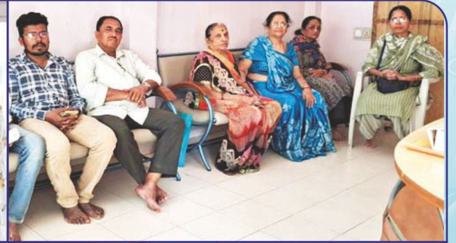
General health checkup camp