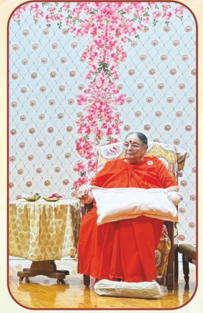
તા.૮-૯-૧૦ મે, ૨૦૨૬ : ગૃહસ્થ ભાઈઓની 'ઘર અને દેહને મંદિર બનાવો' શિબિર...