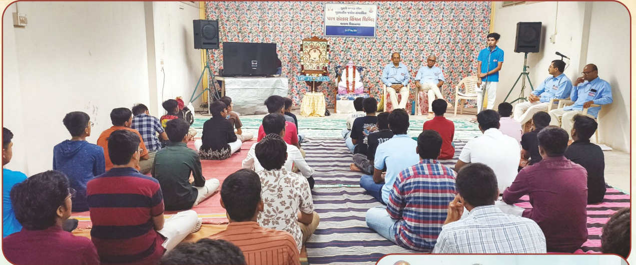
તા.૩ થી ૬ મે, ૨૦૨૬ : કિશોર અને યુવાનોની 'પરમ સંસ્કાર સિંચન શિબિર'...