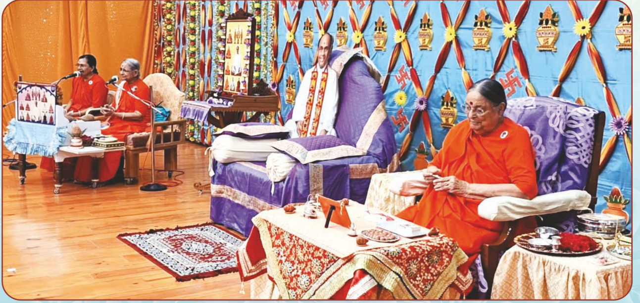
મહાપૂજામાં પ્રાર્થનાભાવ અને થાળ અર્પણ...