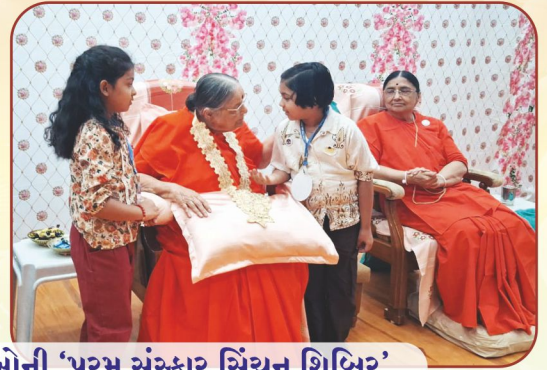
તા.૩ થી ૬ મે, ૨૦૨૬ : બાલિકા, કિશોરી અને યુવતીઓની 'પરમ સંસ્કાર સિંચન શિબિર' ...